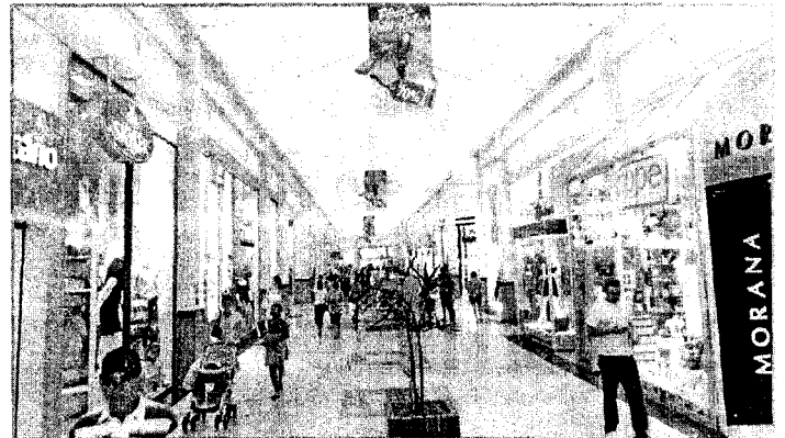
DE ACORDO COM A CONVENÇÃO, O COMÉRCIO LOJISTA DE SÃO LUÍS PODERÁ FUNCIONAR EM REGIME DE HORÁRIO LIVRE, DE SEGUNDA A SÁBADO

Além do salário-base, a nova CTT também estabelece normas para horários especiais de funcionamento do comércio