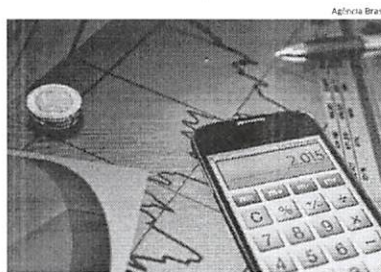
A planilha no computador é preferida de duas em cada dez pessoas

Segundo Magalhães, em dezembro, a indústria costuma demitir, depois de atender à demanda de final de ano do comércio. "A agropecuária está em período de entressafra", acrescentou. Ele citou ainda que no setor de serviços, o peso maior é os segmentos de ensino, com demissão de trabalhadores (temporários tanto na iniciativa privada quanto na pública). "Apenas o comércio que ainda pode permanecer contratado. Construção civil tem período de chuvas, com suspensão dessas atividades de obras".